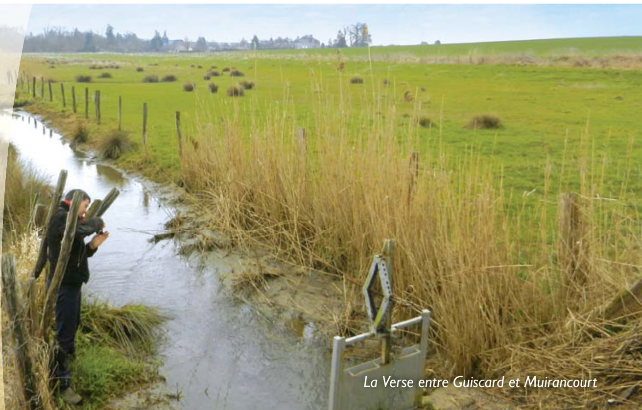
La Verse entre Guiscard et Muirancourt

Avricourt Beaugies-sous-bois Beaulieu-les-Fontaines Beaumont-en-Beine Beaurains-les-Noyon Berlancourt Bussy Campagne Candor Catigny Crisolles Ecuville Flavy-le-Meldeux Fréniches Frétoy-le-Château Genvry Golancourt Guiscard Guivry Lagny Le Plessis-Patte-d'Oie Maucourt Morlincourt Muirancourt Noyon Ognolles Pont-l'Evêque Porquericourt Quesmy Salency Sempigny Sermaize Vauchelles Villeselve