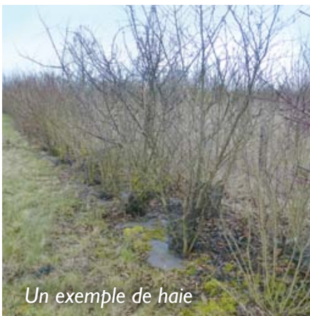
Un exemple de haie