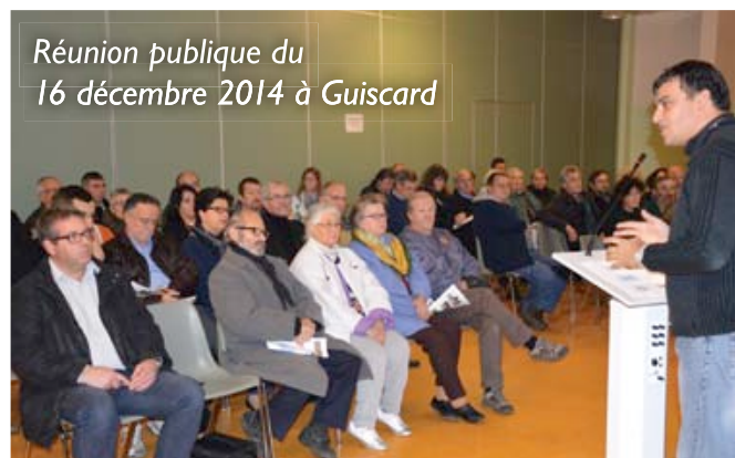
Réunion publique du 16 décembre 2014 à Guiscard

Contact : 03 44 38 83 86 riotte.eptboise@orange.fr